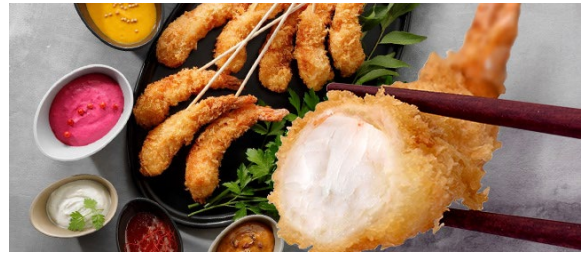
▲築地まかない海老フライ