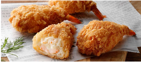
▲開き海老の贅沢ベシャメルフライ

商品は当社の人気商品である業務用商品などをご用意しています。他にも、外食店といったリアル店舗でしか味わうことができない商品や、現地へ行かないと手に入れることができないような高付加価値な商品など、さらに商品ラインナップを拡充していく予定です。